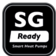
Label voor warmtepomp die op slimme elektriciteitsnetten kan worden aangesloten