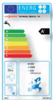
Energie label Vitocal 060-A, type T0E